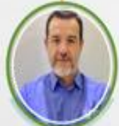
Elder Dare Esp. Processos da Qualidade