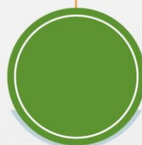
Open position Gerente Técnico Monogástricos